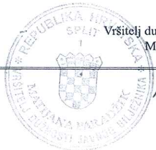
Vršitelj dužnosti javnog bilježnika Matijana Paradžik